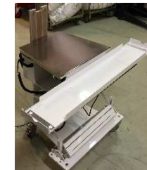
Plateau de travail adapté au scelleuses utilisées